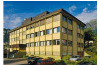
GfK Switzerland AG