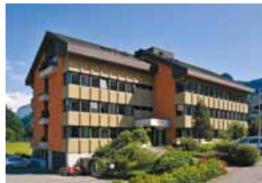
GfK Switzerland AG