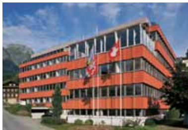
GfK Switzerland AG